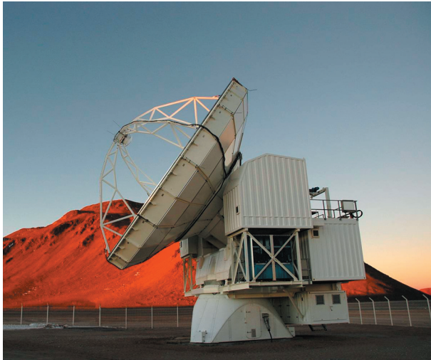
Abb. 1: APEX kurz vor Sonnenuntergang mit Cerro Chajnantor im Hintergrund.